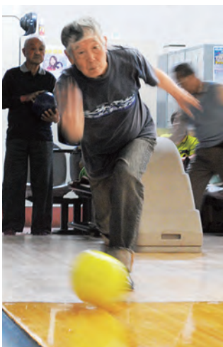
真剣な表情でボールを投げる男性(上)とハイタッチで喜び合う会員たち

条例では、「多様性の尊重」「支え合い」「社会参画の機会確保」という3つの基本理念のもとに、共生社会についての意識形成や社会基盤の整備、推進体制の構築、災害への対応などの施策を進めるため、職員の