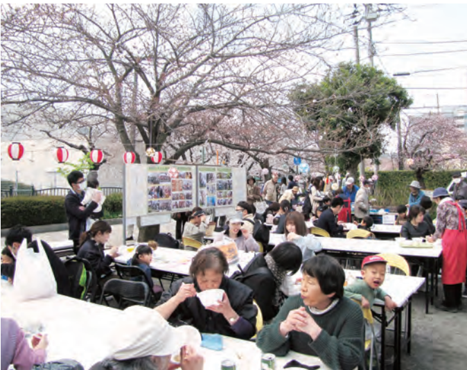
満開の桜の下に集った地域の皆さん

久々に満開を迎えた「砂押川沿いさくら祭り」が3月31日に開催され、多くの花見客で賑わいました。この催しは、岩瀬地域の人々を中心にみんなでお