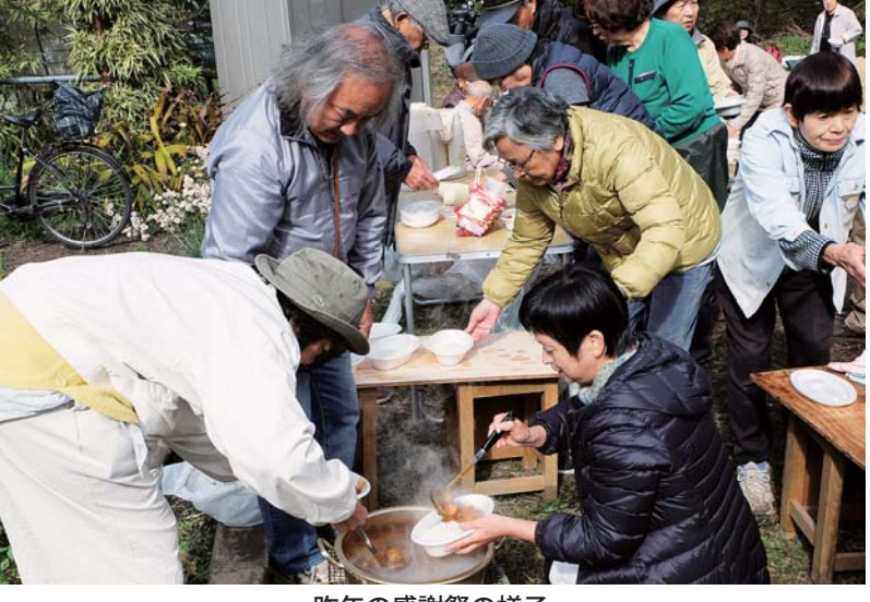
昨年の感謝祭の様子