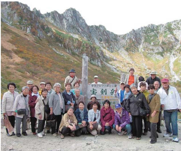
ロープウェイで到着した千畳敷カールで記念撮影